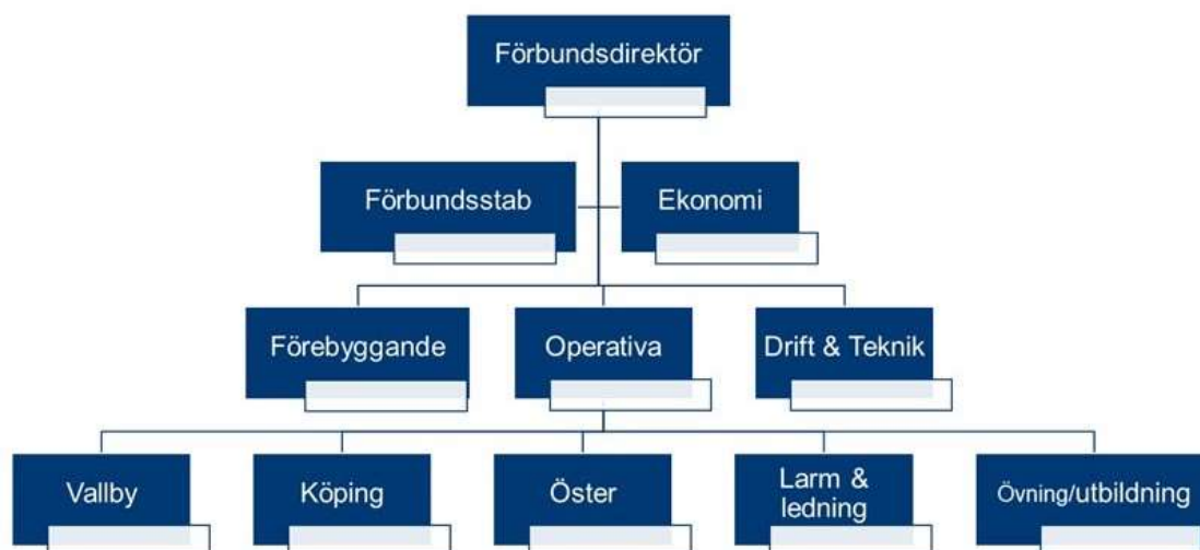
Organisationsstruktur för RTMD