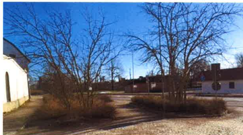
Träd. Beskärs årligen för skymd sikt.

Vår bedömning: Ingen åtgärd krävs utöver vanlig skötsel.