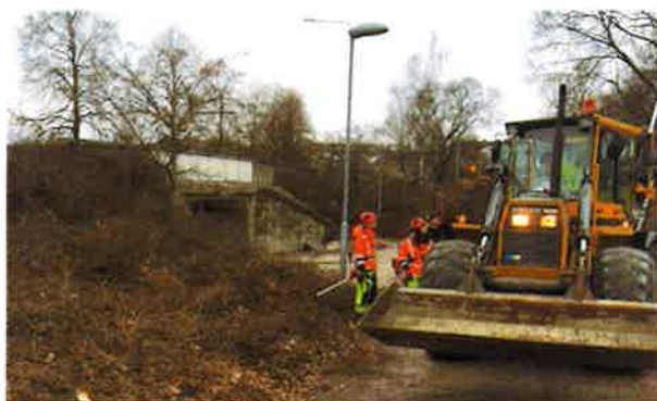
Röjning den 21:a mars, 2019 (TK)