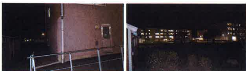
Mörka ytor på Nygård. Släckt fasadbelysning samt bristfälligt belysta ytor.

Synpunkter och identifierade otrygghetsskapande aspekter runt Nygård rör främst belysningsfrågor och otrygghetsskapande samlingar av ungdomar. Under vandringen upptäcktes flertalet trasiga fasadbelysningar eller att fungerande belysning var otillräcklig.