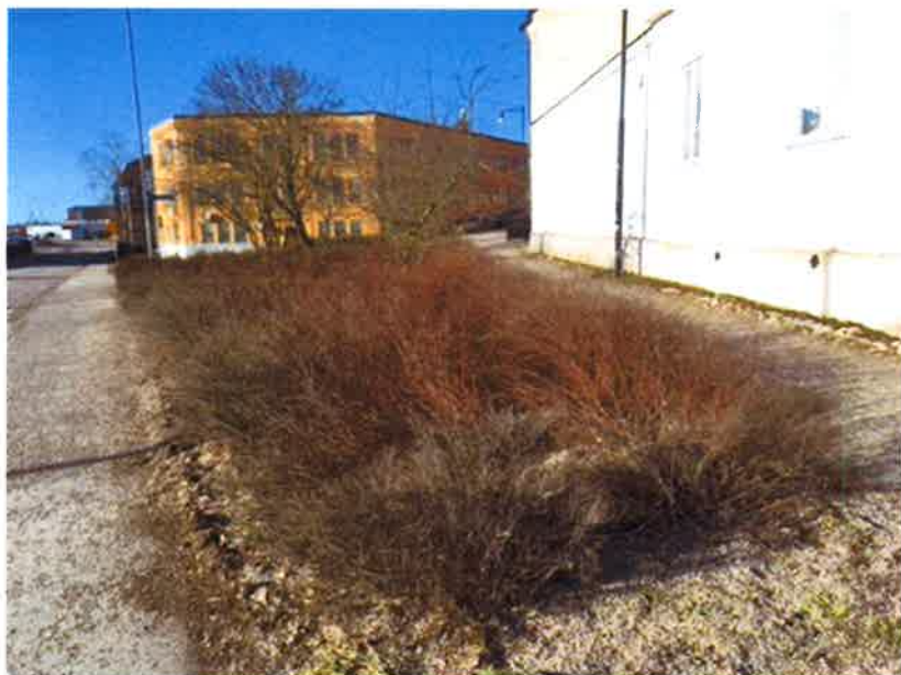
Platsbesök den 8:e mars. Buskar spirea och tok. Skötsel: klipps årligen efter gångbanan, övriga delar 5-10 års intervall.