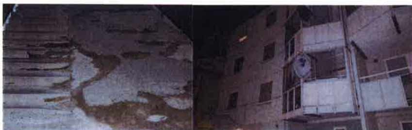
Säkerhetsrisker. Trasig ramp och trappsteg samt paraboler som hänger utanför balkongerna utgör risker och begränsar tillgängligheten.

Utöver belysning och otrygghetsskapande samlingar av ungdomar noteras även trasiga ramper till innergården mellan nämnda adresser. Boende upplever att det är farligt att gå med barnvagn där. Tillgängligheten begränsas således också för de som är i behov av att använda rampen. Paraboler som är placerade utanför balkonger upplevs också som en säkerhetsrisk.