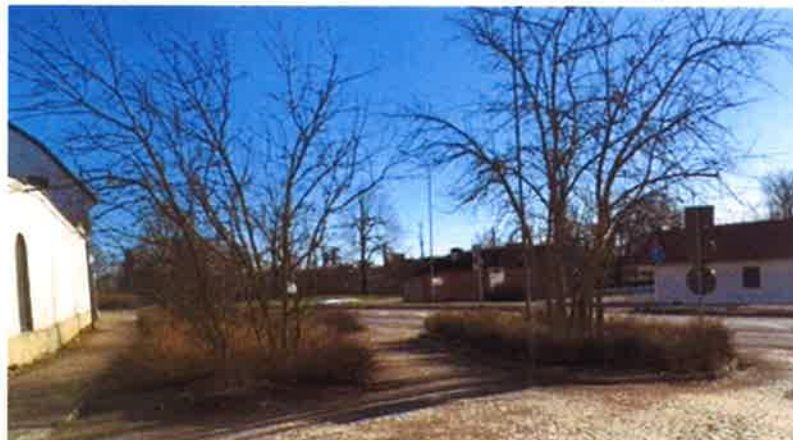
Träd. Beskärs årligen för skymd sikt.

Vår bedömning: Ingen åtgärd krävs utöver vanlig skötsel.