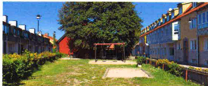
Träd och buskar vid lekplats. Beskärs årligen för skymd sikt.