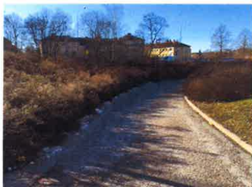
Platsbesök den 8:e mars, 2019 (TK)