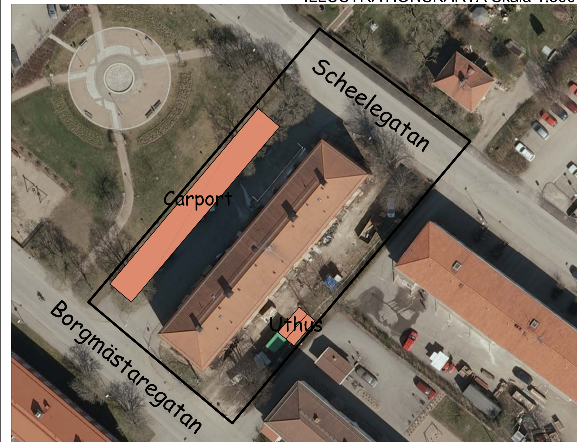
ÖVERSIKTSKARTA Skala 1:2000