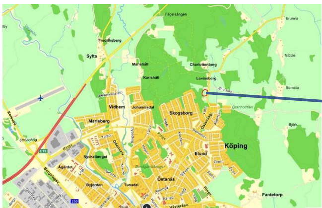
Figur 1.1 Detaljplaneområde markerat med rött.

Tyréns har på uppdrag av Köpings kommun gjort en bedömning av byggbarheten i ett detaljplaneområde i Västra Sömsta, Köping (figur 1.1). Geotekniska fältundersökningar utfördes i samband med en dagvattenutredning i samma område varav tre punkter är lokaliserade inom detaljplaneområdet. Undersökningens omfattning finns beskriven och redovisad i plan och sektion i bifogad MUR (markteknisk undersökningsrapport) daterad 2017-10-06. Dessa tre punkter, tidigare geotekniska undersökningar utförda av andra konsulter, observationer av fältgeotekniker och SGU:s jordartskarta har utgjort grunden för detta PM. Observera att detta PM är av översiktlig karaktär, för detaljprojektering av grundkonstruktioner och fyllningar erfordras en detaljerad geoteknisk utredning.