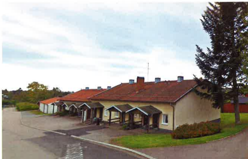
Byggnaderna på fastighet Ekbacken2:3. Källa: GoogleMaps, 2019