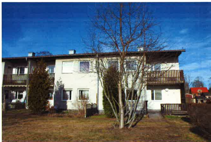
Den södra byggnadens "baksida" och gård.