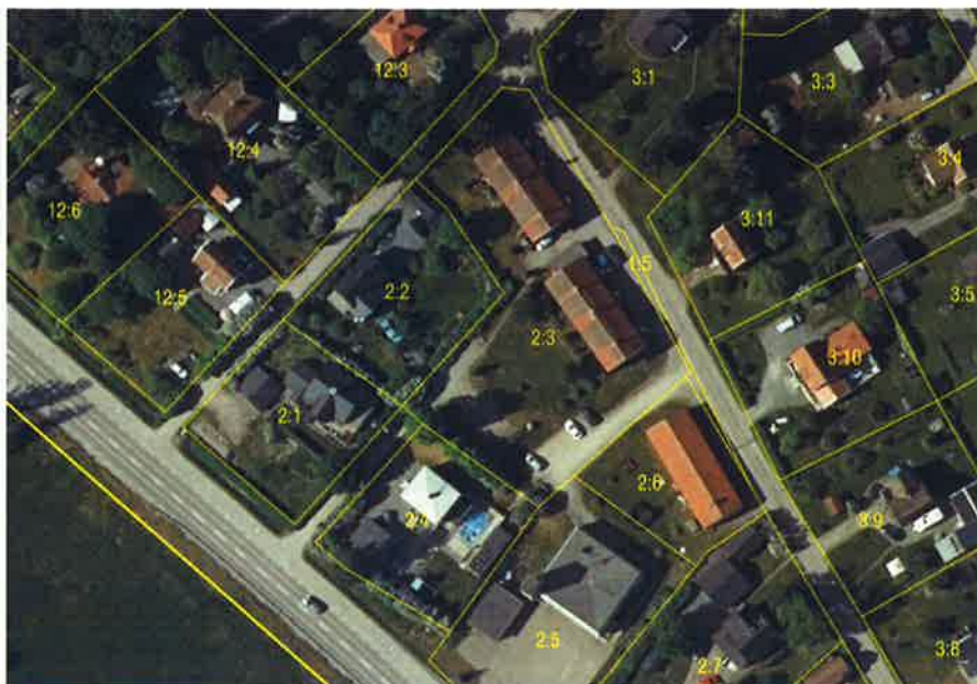
Fastighet Ekbacken 2:3, Kolsva.