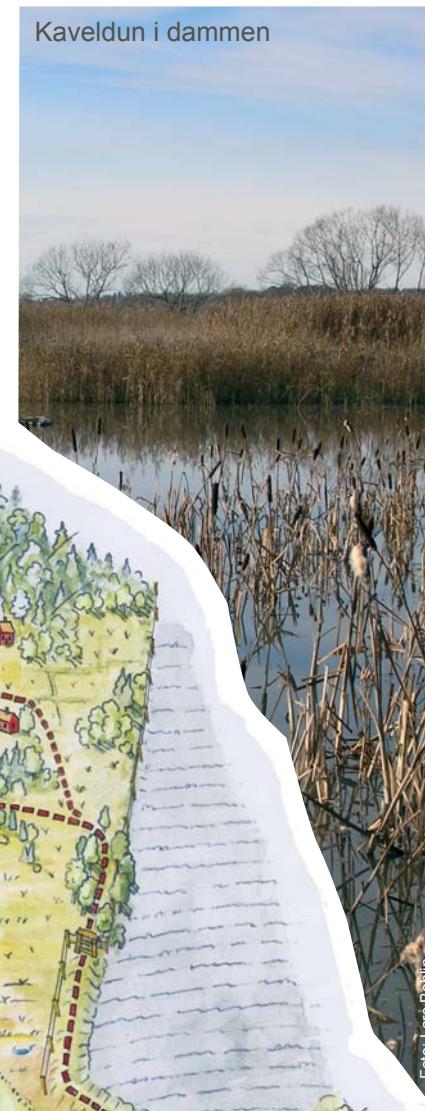
Kaveldun i dammen