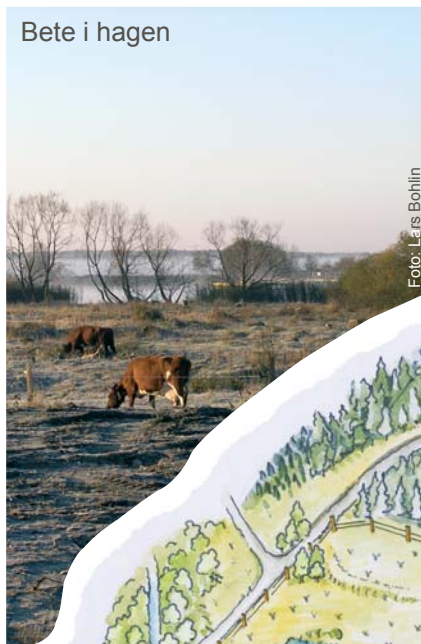
Bete i hagen

Nötkreatur betar återigen hagmarken, vilket är en förutsättning för många växter som låsbråken, orkidéer och rödkämpar. Växterna är i sin tur nödvändiga för många insekter. Tillsammans ett myllrande Norsa hagar.