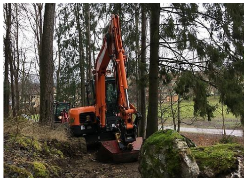
Grävmaskiner på plats vid Nyckelberget