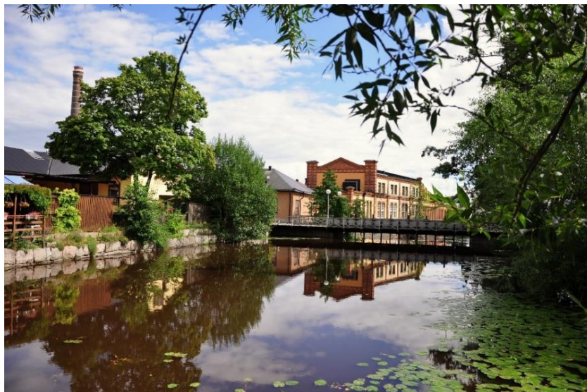
Köpingsån vid Dambron

Under januari-augusti 2020 har anmälningar av tillbud och arbetsskador utan frånvaro minskat i jämförelse med samma period 2019. Dock har antalet anmälningar av arbetsskador med frånvaro ökat något mellan perioderna.