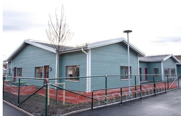
Förskolan Savannen i Kolsva har sex avdelningar och en stor gård med lekredskap runt nästan hela förskolan

De största avvikelserna ligger på larm/låssystem och investeringar i välfärdsteknik sammanlagt 5,3 Mkr, dessa investeringar kommer att fortsätta 2021. Tvätteriet har färdigställts under året med ett underskott på 2,1 Mkr. Detta kompenseras av övriga inventarier.