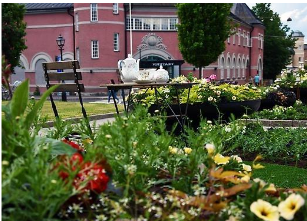
Årets tema för sommarblommorna är fika

Köpings kommun har tre utvecklingsmål som beslutades av kommunfullmäktige de 16 december 2019. Utvecklingsmålen är långsiktiga och sträcker sig från 2020 - 2027. Till varje mål finns en målsamordnare som leder arbetet. Under året har arbetet med att ta fram en handlingsplan för respektive utvecklingsmål påbörjats. I arbetet med handlingsplanen för respektive mål görs bland annat en analys av nuläget, våra styrkor, svagheter och möjligheter, omvärldsfaktorer, förslag på strategier, samt en prioritering av dessa.