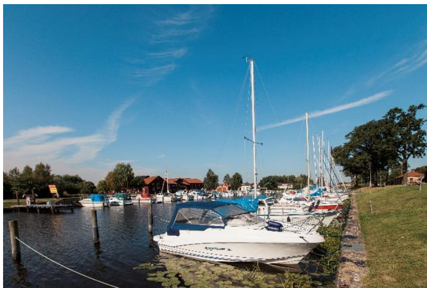
Fritidsbåtar i Inre hamnen

Styrelsen och nämnderna har totalt 20 internkontrollpunkter varav tre är kommungemensamma. Av dessa kontrollpunkter har fem kontrollerats under året, för resterande 15 punkter ska kontrollen genomföras under hösten.